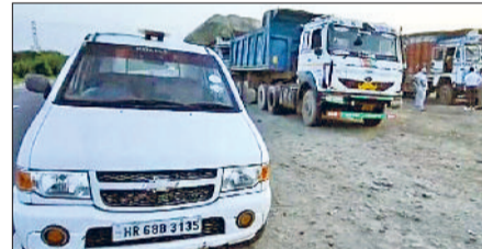
रेवाड़ी। सीएम फ्लाइंग ने पकड़े ओवरलोड वाहन, मौके पर मौजूद सीएम फ्लाइंग टीम।