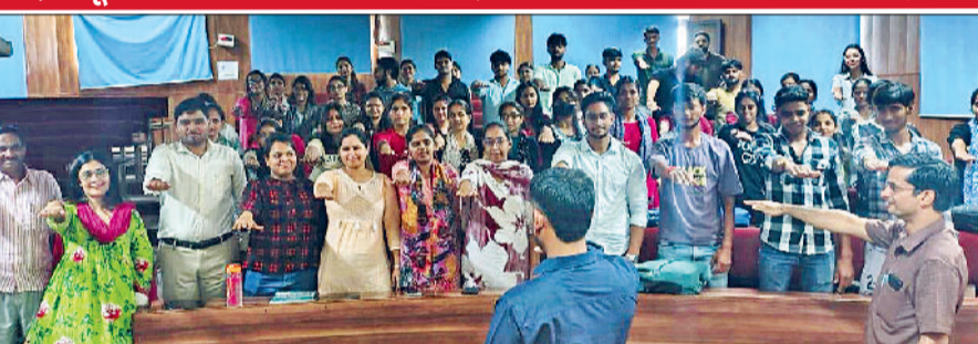
रेवाड़ी। कार्यक्रम में शपथ लेते शिक्षक व विद्यार्थी।