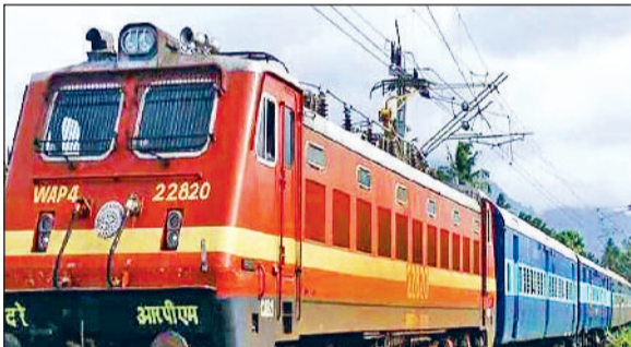
रेवाड़ी। उत्तर-पश्चिम रेलमार्ग से गुजरती एक्सप्रेस ट्रेन।