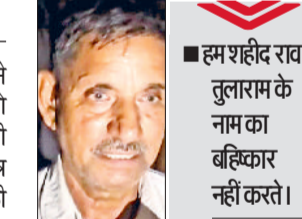
हम शहीद राव तुलाराम के नाम का बहिष्कार नहीं करते।