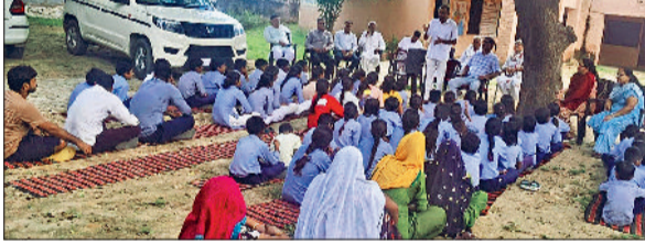
रेवाड़ी। स्कूल में विद्यार्थियों व ग्रामीणों को जानकारी देते हुए पुलिस टीम।

उन्होंने कहा कि नशा एक सामाजिक बुराई है और इस बुराई के विरुद्ध सामाजिक आंदोलन चलाने की आवश्यकता है। समाज का प्रत्येक नागरिक नशा मुक्त समाज