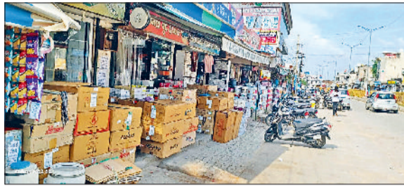
रेवाड़ी। धारूहेड़ा के बाजार में दुकानों के आगे रखा सामान तथा धारूहेड़ा के बाजार में दुकानों के आगे रखा सामान।

धारूहेड़ा कस्बे से गुजर रहे सोहना-पलवल नेशनल हाइवे-919 और बाजार में दुकानदारों की ओर से किए अतिक्रमण व अवैध कब्जों के कारण सड़कें सिकुड़ कर रह गई हैं। कस्बे की 90 से 110 फीट चौड़ाई की सड़क महज 40 फीट रह गई है। भगत सिंह चौक से नगरपालिका कार्यालय तक दुकानदारों व खरीदारी करने वाले ग्राहकों को गाड़ियां अवैध रूप से सड़क पर खड़ी हो रही हैं, जिससे जाम के कारण अलवर, भिवाड़ी, सोहना व पलवल जाने वाले वाहन चालकों को परेशानी का सामना करना पड़ रहा है। सड़क पर अतिक्रमण के कारण किसी भी आपात स्थिति में मार्ग