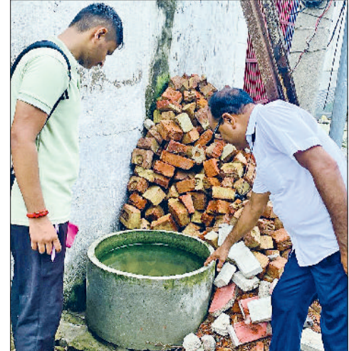
रेवाड़ी। पानी की टंकी में लावा की जांच करते स्वास्थ्यकर्मी।

अगस्त माह में डेंगू के लगातार बढ़ते मामले थमने का नाम नहीं ले रहे हैं। मंगलवार को जिले में 4 डेंगू पॉजिटिव मरीज मिलने से आंकड़ा 64 पर पहुंच गया है। गत वर्ष 2024 में अगस्त माह में 8 डेंगू पॉजिटिव केस मिले थे। बरसात के बाद जलभराव होने मच्छरों का प्रकोप काफी बढ़ गया है। स्वास्थ्य विभाग लोगों को बीमारियों से बचाव के लिए जागरूक कर रहा है। जिले में डेंगू के मामलों के साथ अब तक 11 मलेरिया के केस भी मिल चुके हैं। स्वास्थ्य विभाग के एचआई, एमपीएचडब्ल्यू व ब्रीडिंग चेकर लगातार गांवों व शहरी क्षेत्र में सोंस रिडक्शन का कार्य कर रहे हैं तथा बुखार से पीड़ित लोगों की स्लाइड भी तैयार की जा रही है।