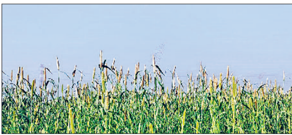
रेवाड़ी। एक किसान के खेत में पककर तैयार खड़ी बाजरे की फसल।

सकती है। मंगलवार को सुबह के समय आसमान में आंशिक बादल छाए रहे। दोपहर तक आसमान साफ हो गया। इसके बाद तेज धूप निकलते ही गर्मी का असर बढ़ गया। अधिकतम तापमान 1.0 डिग्री सेल्सियस बढ़कर 35.0 डिग्री पर पहुंच गया। न्यूनतम तापमान 0.9 डिग्री की वृद्धि के साथ 23.5 डिग्री सेल्सियस दर्ज किया गया। दो दिन तक हुई बूदाबांदी व हल्की बरसात के कारण हवा में नमी का स्तर 78 फीसदी तक बना रहा। हवा की