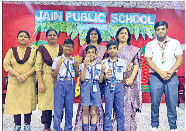
रेवाड़ी। पदक विजेता खिलाड़ी कोच व शिक्षकों के साथ।