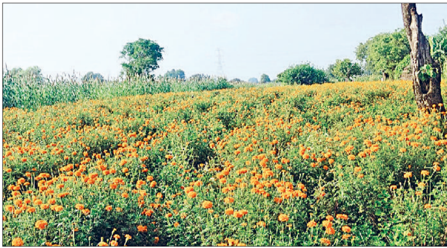
रेवाड़ी। ढाणी कोलाना में एक खेत में खड़ी गंदे की फसल।

गंदे की खेती की ओर किसानों का रुझान बढ़ने लगा है। इस बार मानसून सीजन से पहले ही गंदे की फसल बुरी तरह प्रभावित हो गई, जिससे कम उत्पादन ने गंदे के दाम आसमान पर पहुंच दिए। जब भाव अच्छे मिल रहे हैं, तो किसानों के पास गंदे नहीं है। जब उत्पादन अच्छा होता है, तो किसानों को पर्याप्त दाम नहीं मिल पाते। इस समय गंदे के फूलों के दाम काफी बढ़े हुए हैं, जिस कारण किसानों ने बड़ी संख्या में गंदे की पौध लगाना शुरू कर दिया है। जिले में गंदे की खेती ने लगभग पांच साल से रफ्तार पकड़ना शुरू किया हुआ है। चंद एकड़ से गंदे के फूलों की खेती शुरू हुई थी, जो अब हजारों