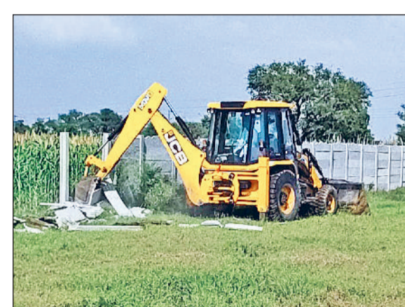
रेवाड़ी। अवैध कॉलोनीयों में किए गए निर्माण को गिराती जेसीबी।

जिले की राजस्व सीमा में बिना अनुमति निर्माण करने वाले लोगों के खिलाफ डीटीपी का एक्शन तेज हो गया है। डीटीपी की टीम ने बुधवार को पटौदी रोड पर 4 एकड़ में किए गए निर्माण ध्वस्त कर दिए। डीटीपी की इस कार्रवाई से अवैध रूप से निर्माण करने व कॉलोनियां काटने वाले लोगों में खलबली मच गई। डीटीपी की टीम ने बुधवार को ड्यूटी मजिस्ट्रेट और पुलिस बल के साथ पटौदी रोड पर गांव दोहकी की राजस्व सीमा में पहुंची। जहां पर डीटीपी की जेसीबी ने 4 एकड़ में विकसित रहे ही अवैध कॉलोनी पर तोड़फोड़ की कार्रवाई की। डीटीपी