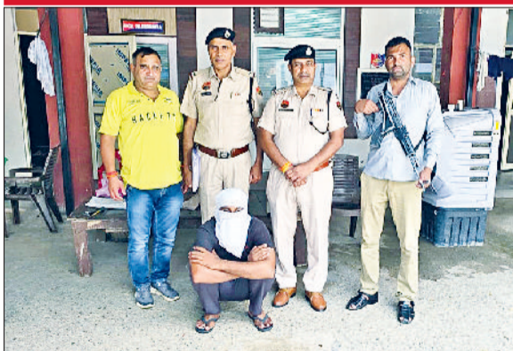
रेवाड़ी। पुलिस गिरफ्तार में हत्या का आरोपी।